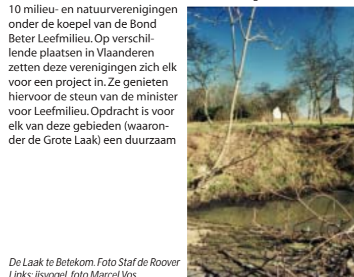
De Laak te Betekom. Links: ijsvogel

Het watersysteem van de Grote Laak kent geen grenzen tussen de stad Aarschot en het stroomafwaarts gelegen buitengebied. Het herstel van de Laak moet van bron tot monding gebeuren. Het lopende project van het Regionaal Landschap Noord-Hageland wordt door Natuurpunt Oost-Brabant vzw uitgebreid voor de stroomafwaartse loop van de Laak. Daar gaat het vooral om herstel van waardevolle natuurgebieden en een mooi landschap in de open ruimte. Het project kreeg erkenning en goedkeuring binnen het Vlaams Waterfront, een samenwerkingsverband van 10 milieu- en natuurverenigingen onder de koepel van de Bond Beter Leefmilieu. Op verschillende plaatsen in Vlaanderen zetten deze verenigingen zich elk voor een project in. Ze genieten hiervoor de steun van de minister voor Leefmilieu. Opdracht is voor elk van deze gebieden (waaronder de Grote Laak) een duurzaam