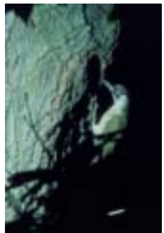
Groene specht, foto archief Natuurpunt

Na 5 minuten langs de Werchterbaan bereiken we terug onze vertrekplaats. We hopen dat dit 'onbekende' gebied je heeft kunnen bekoren. Hopelijk steun je ons in onze actie voor zuiver water, levendige natuur en een mooi landschap in de vallei van de Grote Laak.