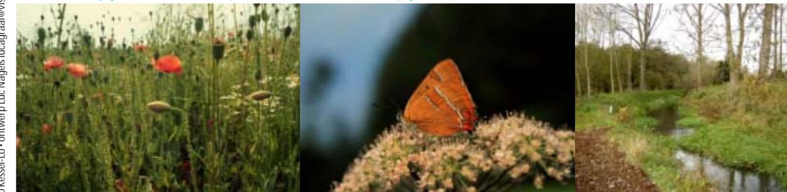
Veldonkbroek, foto Staf De Roover