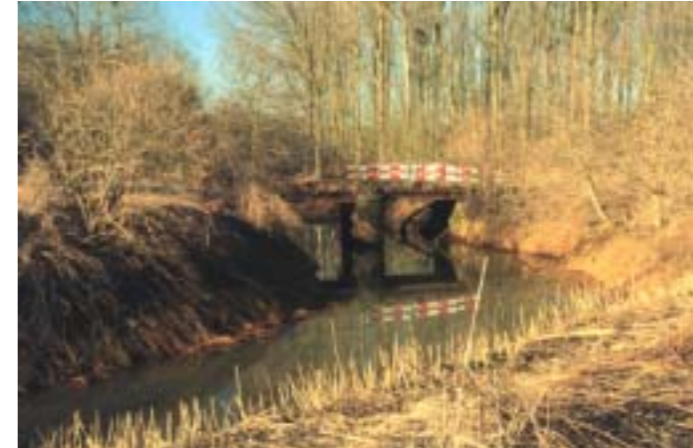
't Schippeke.

De Laak, die al vervuild is als ze Tremelo binnenstroomt, ontvangt hier via de Britspoeibeek het grootste deel van de afvalwaters van Tremelo. Zolang de afkoppeling van de riolen niet is gereali-